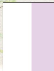
Media vertical 115 x 285 mm