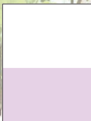
Media horizontal 210 x 145 mm